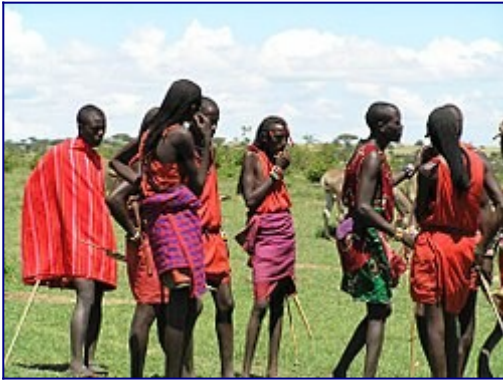
Groupe de Maasäi.

Les Maasäi sont semi-nomades et ont une économie pastorale exclusive. Ils ont résisté aux incitations des gouvernements kényan et tanzanien visant à leur faire adopter un mode de vie plus sédentaire et à adopter l' agriculture . Ils ont acquis le droit de faire pâturer leur bétail dans de nombreux parcs des deux pays et ignorent régulièrement les frontières lorsqu'ils déplacent leurs grands troupeaux de bétail à travers la savane lors des changements de saison.